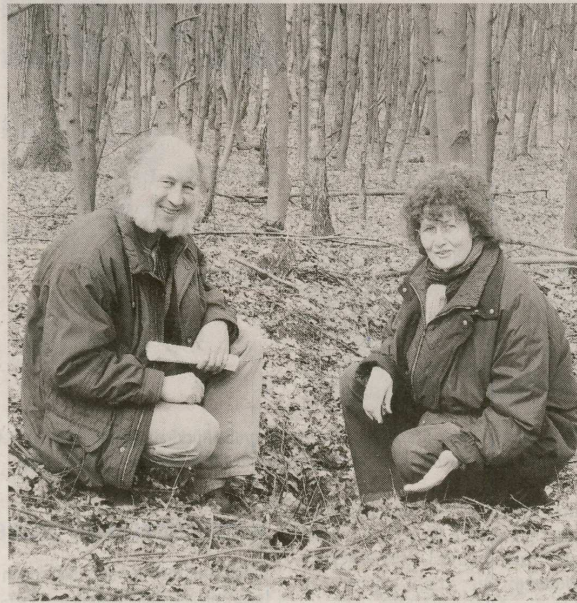
Man benötigt schon etwas Phantasie, um den Hügel im Naturschutzgebiet Dreiecksweiher (siehe Grafik) als MG-Stellung zu identifizieren.

Nun darf man sich einen Feldflughafen nicht als gut ausgebauten Luftdrehkreuz vorstellen – schon gar zu Kriegsende. „Im Gegenteil – sie waren Notmaßnahmen für den letzten Verteidigungskampf“, sagt Schulenberg. Tagsüber beherrschte die alliierte Luftwaffe den Himmel, nur in der Nacht kamen die Abfangjäger aus ihren Verstecken, um den heimkehrenden Bombern aufzu-