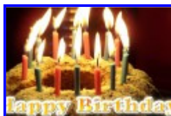
Älteste Düsseldorferin wird 111 Jahre