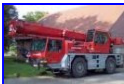
Autokran sorgt für Teilspernung des Kaiser-Friedrich-Rings