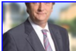
OB Elbers fordert mehr Polizisten für Düsseldorf