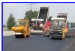
Fahrbahnerneuerungen in der Innenstadt und in Wersten