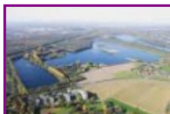
Der Elbsee ist ab sofort das 12. Naturschutzgebiet für Düsseldorf